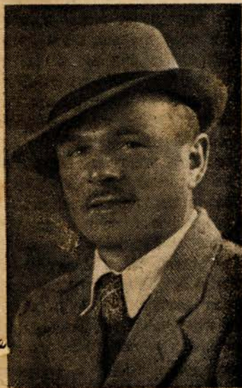
ש.ב. אלף. י"ד תר"ח ראיון

רבים לא ידועה למדי העובדה כי כיום הזה כבר מצויים בצבור העברי מאות רבות, ואולי כמה אלפים, בני הדת הנוצרית, או בני מוצא נוצרי (וכן בני מוצאים אחרים לא-יהודיים). ואין המדובר כאן בגרים או צאצאי גרים (דוגמת רא"ש שוני המושבות הותיקות בגליל התחתון, למשל), אשר התייחדו, התגירו, נמולו וכו' והתאחו בצבור העברי ע"י הדת היהודית אשר קבלו עליהם להלכה הם או אבותיהם; הכוונה היא לרבים רבים אחרים, אשר להלכה נשארו בנצרותם, ולמעשה הרי הם עברים אתאיסטים, כרוב רובה של האיכלוסיה העברית; עברים הם באשר ארצם היא ארץ העברים, לשונם — הלשון העברית, נשותיהם — מבנות הארץ, וילדיהם אינם שונים בכלום מיתר הילדים העברים.