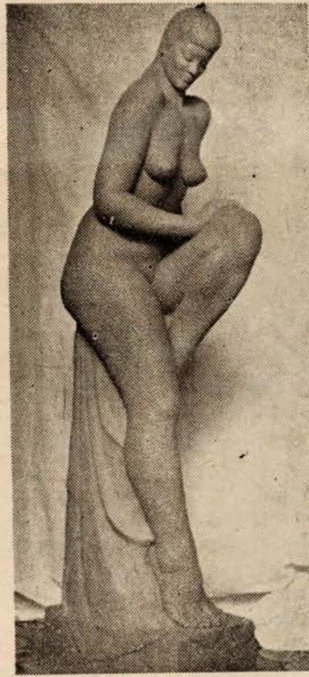
מ. ג'אנה אשה יושבת

אם נאמר שהתפתחה בצבור העברי "תודעה" של ציור, הנה "תודעה פיסולית" חסר הוא עדיין. במספר פרוטות יכול כל אדם לרכוש לעצמו רפרודוקציה של צייר בעל שם, ולהכניסה אל נווהו. אולם אין כן הפסל. גם אין הפסל עניי למצנאט פלוני או אלמוני שיקנהו ויקבעוהו במעונו, כל שכן בתנאי הדיור הנהוגים בארץ.