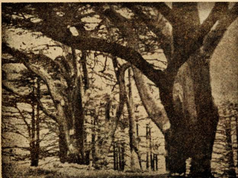
שרידיהם של ארוי הלבנון היחדשו תפארתם כקדם?

כמוך, מר שוקייר, סוברים גם אנו כי הלבנון,