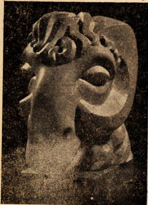
ראש איל (אבן)