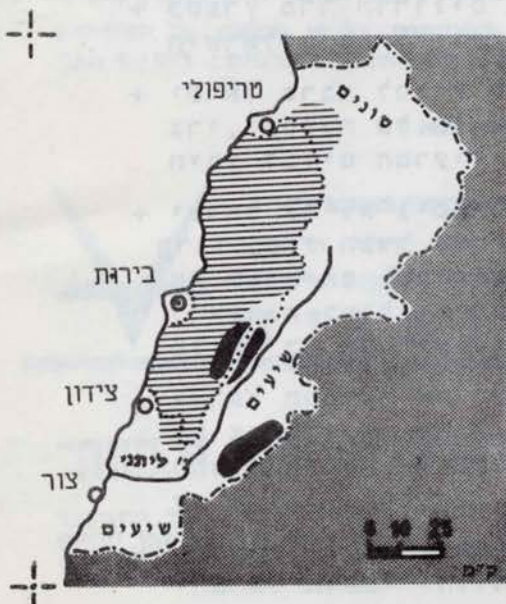
הלבנון, בטרם המנדט הצרפתי, ואחרי